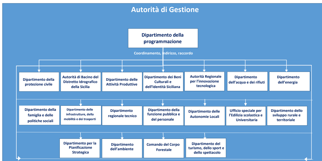
Figura 1 – Composizione dell'Autorità di Gestione

I CdR hanno la primaria responsabilità della corretta esecuzione delle azioni previste dal PR e del raggiungimento dei relativi risultati, attraverso la messa in opera di tutte le misure necessarie, anche di carattere organizzativo e procedurale, idonee ad assicurare il corretto utilizzo delle risorse finanziarie e il puntuale rispetto della normativa comunitaria e nazionale applicabile.