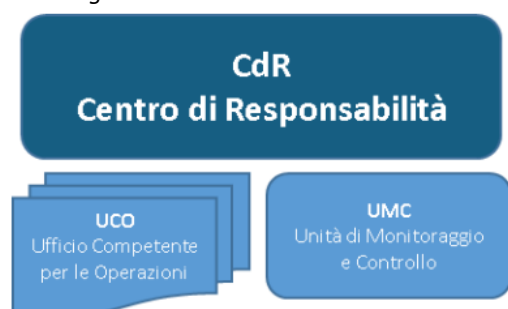
Figura 2 – Organizzazione dei CdR

L'attività di selezione, gestione e attuazione delle operazioni è assicurata dai Dirigenti generali dei CdR responsabili per competenza in materia delle operazioni finanziate che per l'esercizio delle funzioni si avvalgono dei rispettivi Uffici Competenti per le Operazioni (UCO). Essi ne rispondono, nei confronti delle Autorità nazionali e comunitarie, per quanto attiene ai sistemi di gestione e al controllo delle operazioni.